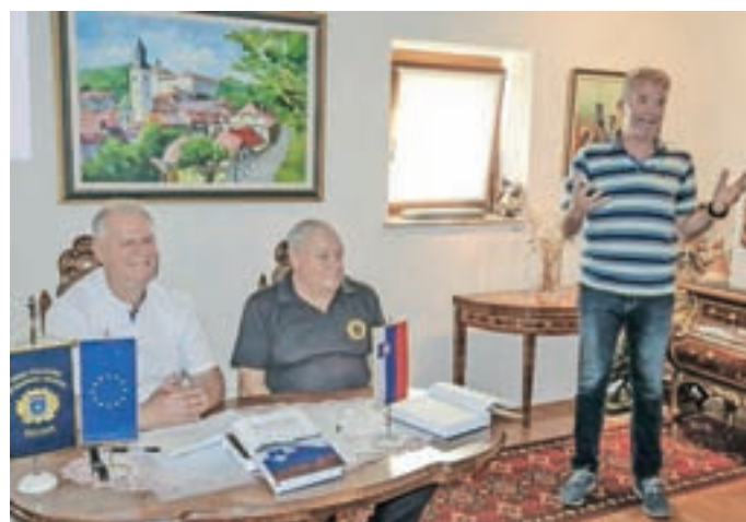
S predavitve knjige v galeriji Krvina v Gorenji vasi.

Kot dober poznavalec problematike državnih meja in reševanja mednarodnih mejnih sporov ter ekspert in pogajalec slovenskih vladnih delegacij v procesih osamosvajanja in določanja slovensko-hrvaške meje v treh poglavjih na več kot petsto straneh opisuje "trilogijo" vzpostavljanja slovenskih meja, so zapisali ob izidu knjige. Avtor se na začetku osredotoča na obdobja po prvi in po drugi svetovni vojni ter dogajanja ob velikih ozemeljskih preureditvah Evrope na mirovnih konferen-