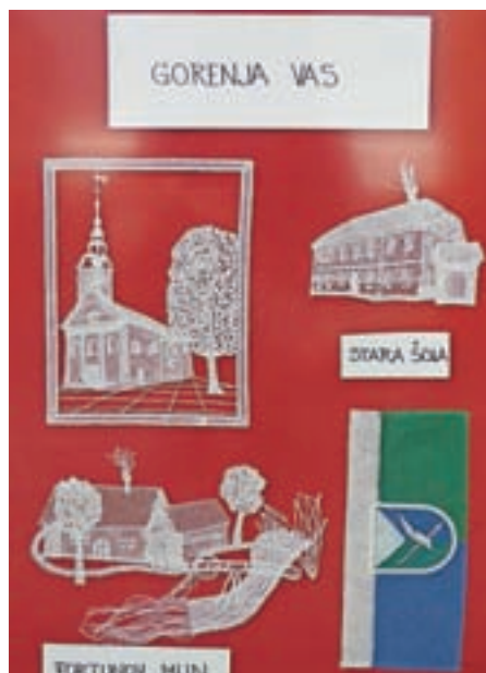
Gorenjevaške znamenitosti v čipki

Poleg čipk na temo teh obrti so razstavljale stara orodja, povezana z njimi, nekaj zanimivih predmetov jim je posodilo tudi Prostovoljno gasilsko društvo Gorenja vas. Obudile so tudi spomine na nekdanjo industrijo, predvsem podjetja Alpina, Jelovica, Kroj, Šešir in Rudnik urana Žirovski vrh, ki so delovali v Gorenji