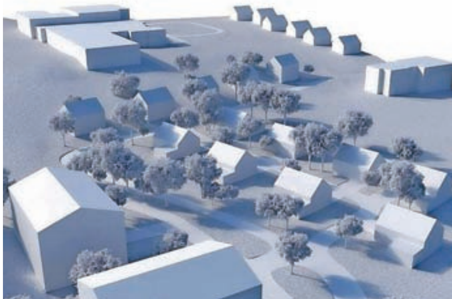
Predvidena umestitev stanovanjskih objektov na Blatih v Gorenji vasi

Poleg odloka OPN sestavljajo tudi obsežne kartografske priloge, v katere je bilo vnesenih več kot 400 sprememb, uveljavljenih na osnovi več kot 250 pobud in pripomb občanov. Te so bile v celoti ali deloma upoštevane, saj so se morale prilagoditi mnenjem skupno 24 soglasodajalcev na ministrstvih in državnih zavodih ali pogojem upravljavcev