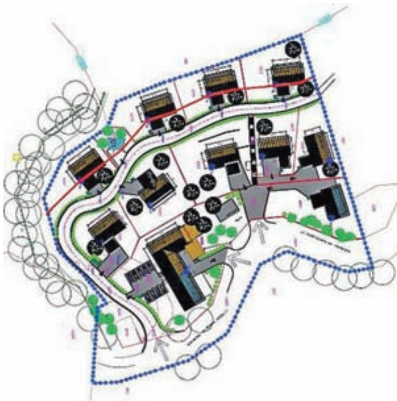
Predvidena umestitev stanovanjskih objektov ob nekdanjem gostišču na Hlavčih Njivah.

Skupna površina vseh zazidljivih zemljišč se je povečala za 5,7 ha. Po