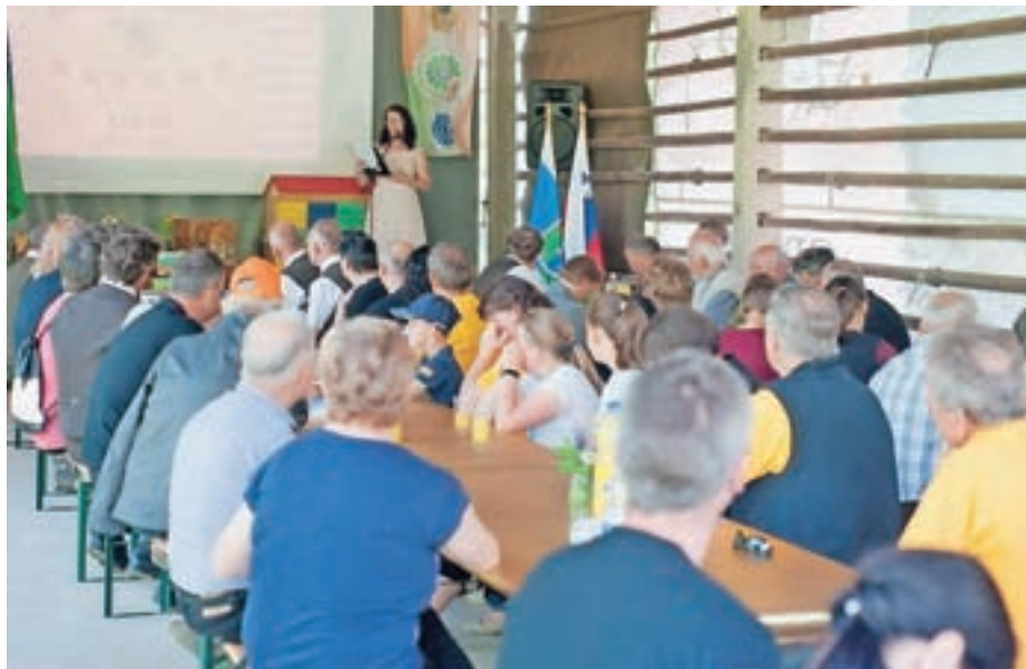
Čebelarsko društvo Blegoš je zabeležilo sto deset let delovanja.

V 70-ih letih prejšnjega stoletja so kranjice dočakale prvi dopust na Hrvaškem. Slovenski čebelarji so namreč čebele začeli voziti v Dalmacijo. Kmalu po letu 2000 so čebelarji izbrali svoj slogan: Pod Blegošem pase se kranjica, nabira nektar za rudeča lica, nastala je blagovna znamka Med izpod Blegoša. Društvo se je vsa zadnja desetletja močno povezal z najmlajšimi generacijami v šolah in vrtcih, kar je najboljša naložba za prihodnost čebelarstva, tako z vidika ljubezni do čebelarjenja kot ljubezni do domačega, v Poljanski dolini pridelanega medu. Društvo ima svoj prapor, uredilo je tudi prvo čebelarsko pohodniško pot v Slove-