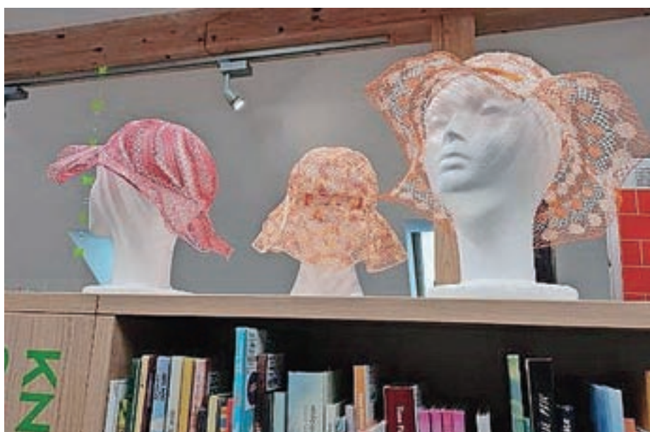
Razstava klekljanih klobukov

v skrbi za naravno in kulturno dediščino ter empatično strpnost.