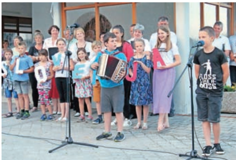
Praznovanje dneva državnosti v Novi Oselici je znova povežalo vse generacije.