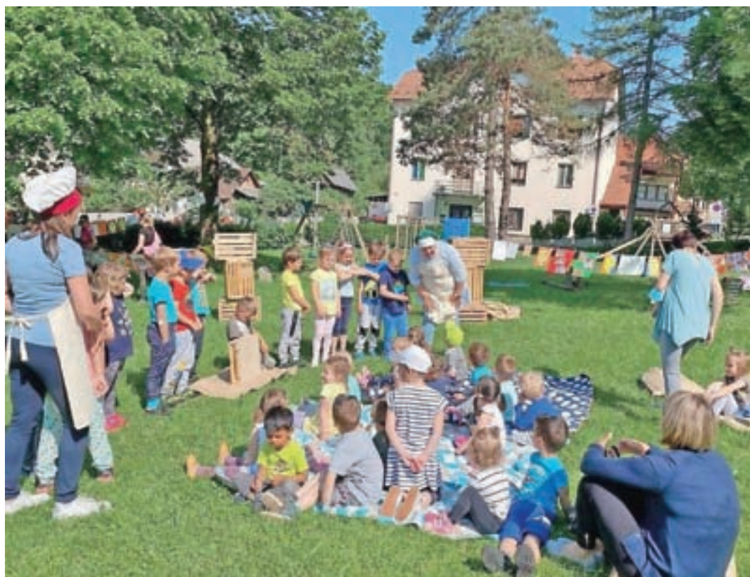
Otroci iz Vrtca Agata so razstavili izdelke na temo hrane.

Skozi celo leto smo imeli v skupini veliko dejavnosti na to temo. Pri tem smo imeli dve pomočnici, chefa Rozinko in Cukrčka. Skupaj smo spoznavali slovensko kulinariko: spekli smo pohorsko omleto, okušali blejsko 'kremšnito', bučno in olivno olje ... Sami smo tudi naredili maslo in jogurt, iz hrane, ki nam je ostala pri obrokih, pa smo naredili sladico in napolnili tortilje. Za konec projekta smo poleg razstave morali pripraviti tudi sladico z lokalnim pridihom. Naredili smo sladico v lončku s hruškami, skuto in sirupom materine dušice. Razstavo