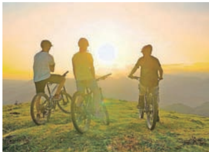
Hidden Hills Trail – najboljša kolesarska pot v Sloveniji

Pot je skrbno zasnovana tako, da vključuje najboljše razgledne točke na tem območju in vodi mimo vseh lokalnih znamenitosti. HHT je iz več razlogov najboljša kolesarska pot v Sloveniji: