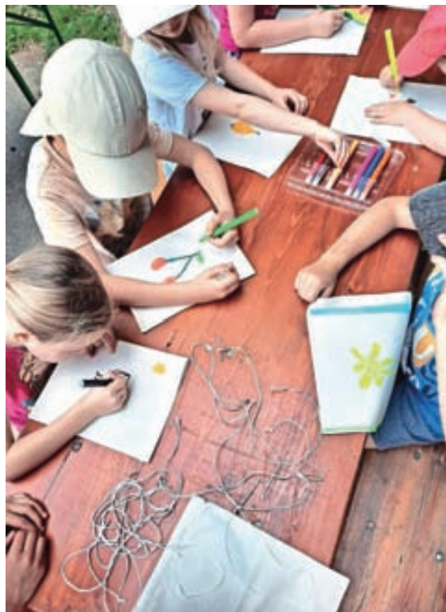
Spretni prstki so ustvarjali na Ermanovcu.

prebiral, o čemer pričajo obrabljene platnice. Izvod ima na naslovni strani zanimivo nalepko v obliki znamke z motivom palače Mestne hranilnice ljubljanske ob njeni 20-letnici.