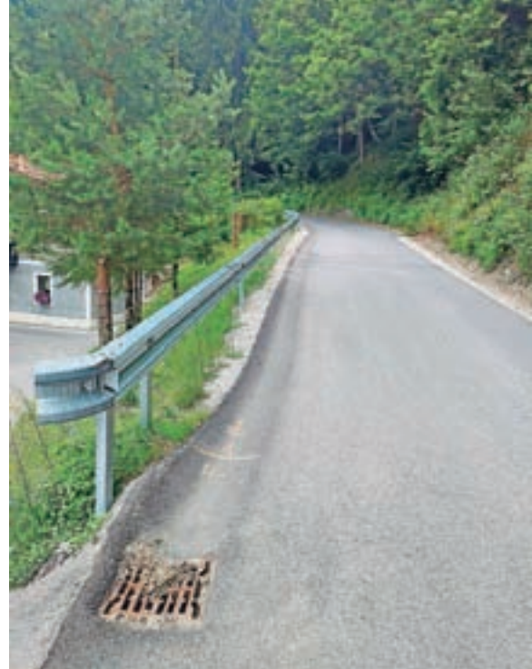
Nova ograja na odseku Murave maln na lokalni cesti Murave–Žetina.

Letos so na območju krajevnih skupnosti Sovodenj in Trebija postavili več metrov novih varovalnih ograj. Postavljene so bile tudi cestne ograje na odsekih Murave–Hlevišje in v Stari Oselici, kjer so lani izvedli investicijsko vzdrževanje. V Krajevni skupnosti Sovodenj so na javni poti Košenija–Rupe postavili 24 metrov ograje na betonskem vencu, na javni poti Sovodenj–Špiček 12 metrov prav tako na betonskem vencu, na javni poti Grapa–Podčrtar–Stata je 20 metrov nove ograje v brežini, na lokalni cesti Sovodenj–Nova Oselica pa 14 metrov na odseku z že obstoječo ograjo.