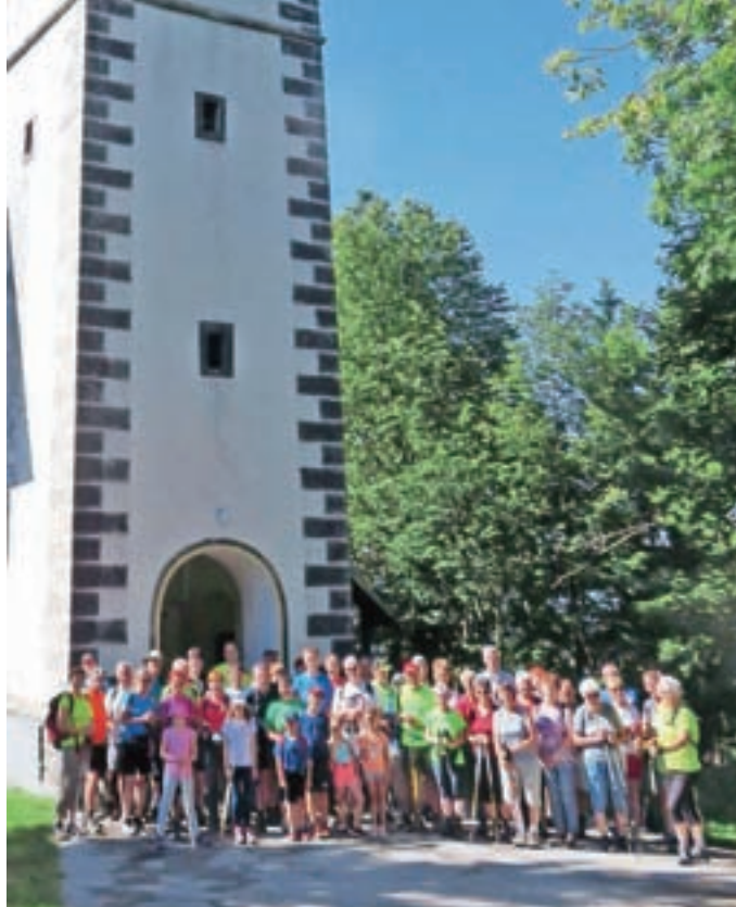
S pohoda Javorje–Žetina–Javorje

V društvu pa vabijo na naslednji pohod, ki bo v nedeljo, 1. avgusta, na dan, ko naj bi bila pod Starim vrhom prireditev Dan oglarjev, a bo praznovanje zaradi razmer tudi letos malce okrnjeno, saj bo potekal le pohod, ki se bo zaključil s slavnostnim